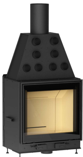
MC 65/60 PLUS