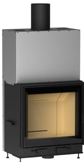
MC 65/60 PLUS для Multifuoco system